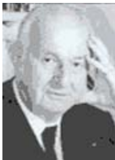
François Perroux

François Perroux est né, à Lyon, en décembre 1903 dans une famille de commerçants. Il fait ses études secondaires au collège des Maristes. Après avoir obtenu l'agrégation des sciences économiques, cet économiste, élève de Schumpeter, enseigne à la Faculté de Droit de Lyon de 1928 à 1937, puis à la Faculté de Droit de Paris, de 1935 à 1955 et également à l'Institut d'Etudes Politiques de Paris, de 1946 à 1952.